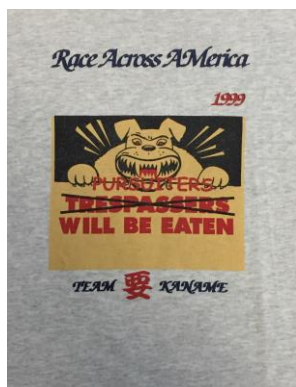
フロントデザイン