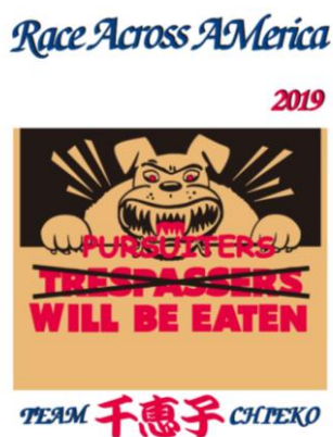
フロントデザイン